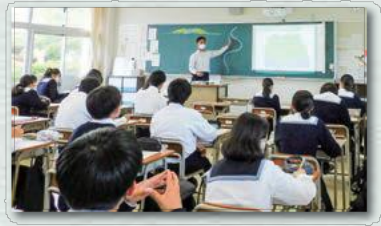
カリキュラム表の数字は1週間の授業数です。