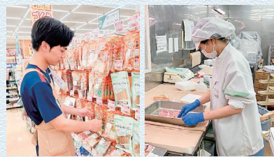
○選択(スポーツ総合Ⅰ、ソルフェージュ、絵画) △選択(情報の表現と管理、演奏実習、構成) ▲選択(国語探究、音楽Ⅱ、美術Ⅱ、英語演習、保育基礎、フードデザイン) ◎選択(ソルフェージュ、絵画) ▽選択(演奏実習、構成) スポーツコースは◎マでスポーツ総合Ⅱを履修