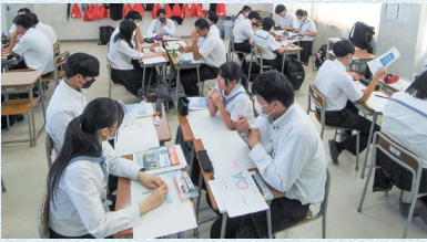
カリキュラム表の数字は1週間の授業数です。